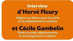
Interview d' Hervé Fleury Adjoint au Maire pour la voirie et les déplacements urbains et Cécile Gambelin Directrice des déplacements et aménagements urbains.

Compte tenu de la réduction de la dotation de l'État aux collectivités locales, la rigueur est de mise. Néanmoins l'enfouissement des lignes et la réfection de la voirie à Porchefontaine se poursuit, avec, en particulier, la rénovation de la rue Yves le Coz entre le pont SNCF et la rue Coste durant l'été 2016 et les travaux d'effacement des réseaux et de réfection de la chaussée, rue de la Fontaine, qui débiteront au dernier trimestre 2016. Ces opérations absorbent une importante partie du budget prévisionnel de notre service pour 2016.