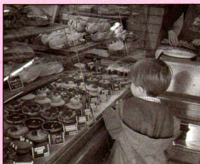
Du bon pain chaud rue Albert Sarraut