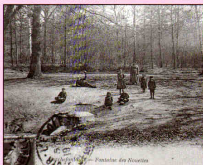
Le ru de Marivel