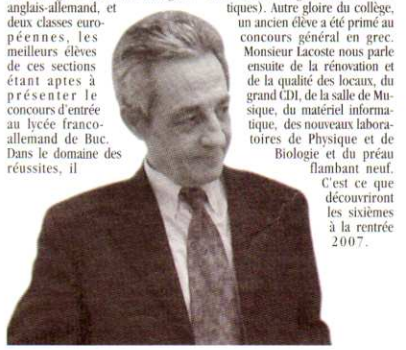
Dossier réalisé par Nathalie Hard, Bernadette Perrutel, Marie-Noëlle Roger, Jean-Sébastien.

fait également signaler l'intérêt des élèves pour les langues anciennes (2 bonnes classes de latinistes et 10 élèves ont été choisis à la fois latin et grec), les très bons résultats des équipes de hand-ball et en 2006, le succès d'un élève de troisième qui est arrivé premier du département au concours kangourou (Mathématiques). Autre gloire du collège, un ancien élève a été primé au concours général en 6 ème . Monsieur Lacoste nous parle ensuite de la rénovation et de la qualité des locaux, du grand CDI, de la salle de Musique, du matériel informatique, des nouvelles laboratoires de Physique et de Biologie et du préau flambant neuf. C'est ce que découvriront les sixièmes à la rentrée 2007.